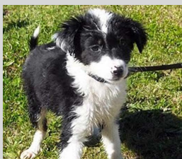
53e - Fêmea

Lembramos que a adopção é totalmente gratuita. O canil oferece na altura da adopção, a vacina anti-rábica, o microchip e a desparasitação interna.