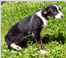
53c - Macho