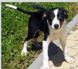
53b - Macho