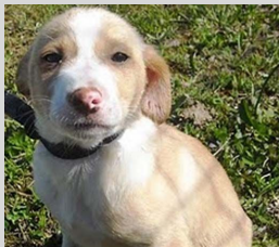
53a - Macho

Anúncio nº 53/2010 5 cachorros, sem raça definida, com cerca de 3 meses que serão de porte médio em adultos, disponíveis para adopção.