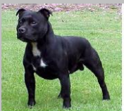
Staffordshire bull terrier