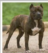
Staffordshire terrier americano