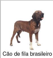
Cão de fila brasileiro