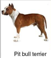
Pit bull terrier