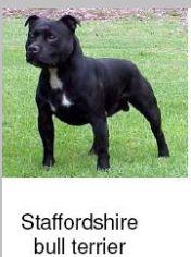
Staffordshire bull terrier