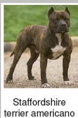
Staffordshire terrier americano