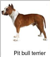
Pit bull terrier