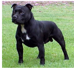
Staffordshire bull terrier