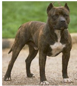
Staffordshire terrier americano