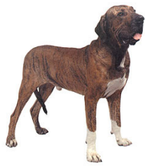
Cão de fila brasileiro