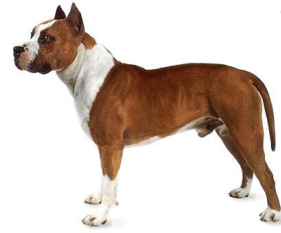
Pit bull terrier